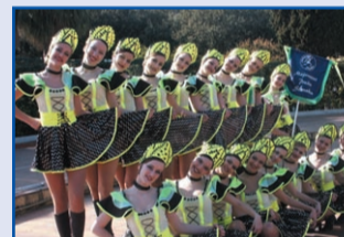
Majorettes SLOVAQUES n°1 en EUROPE

11h30 et 16h30 : Place de la République Concerts avec « MAJORETTES ET FANFARE WITCHES » de SLOVAQUIE 14h30 : Boulodrome du Foulon : Pétanque - Prix des 3 clochers - Concours en doublettes par poules (1000 euros de prix + mises + coupes) organisé par la Pétanque Appaméenne. 18h30 : Apéritif concert avec le Grand Orchestre « Thierry TACINELLI » 22h00 : SPECTACLE et Grand bal de nuit avec « Thierry TACINELLI » et son orchestre 23h00 : « HERBERT LEONARD » accompagné en direct par l'orchestre « Thierry TACINELLI »