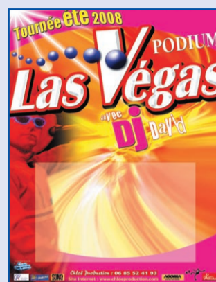
PODIUM LAS VEGAS

14h00 : Esplanade de Milliane : Pétanque - Prix des commerçants, artisans et industriels de la ville de PAMIERS en doublettes (300 euros de prix + mises) organisé par Milliane Pétanque. 16h00 : Fronton Jean Turbé -Stade Balussou. - Présentation de l'école de PELOTE BASQUE DE PAMIERS 16h30 : Stade Balussou : Exhibition Majorettes et Fanfare de SLOVAQUIE 17h00 : GALA de Pelote Basque (Grand Chistera), Fronton Jean Turbé, Stade Balussou. 10ème TOURNOI Jean TURBE : SELECTION DU PAYS BASQUE menée par Peio EXPOSITO Champion du Monde de Cesta Punta contre SELECTION LANDAISE ET PYRENEENNE comprenant des joueurs Appaméens. 18h30 : Place de la République : Apéritif Concert avec « Fred KOHLER » 20h30 : LA GRANDE PARADE 2008 dans les rues de la ville, avec nombreux groupes de fanfares, majorettes, bandas, musique sapeurs pompiers et la participation exceptionnelle de Majorettes et Fanfare de SLOVAQUIE N°1 en EUROPE . Final Esplanade de Milliane 22h00 : Place de la République: Spectacle de Cabaret « Champagn's » et danse avec l'orchestre « FRED KOHLER » 22h00 à 3H30 : Plateau du Castella : « LE PODIUM LAS VEGAS » Tournée Discothèque géante en plein air avec DJ DAVID , SPECTACLE LASER, Gogo danseuses, Méga TEMPÊTE DE NEIGE, VIDEO LIVE sur Ecrans Géants, Kits cadeaux partenaires