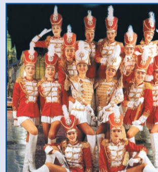
LA GRANDE PARADE